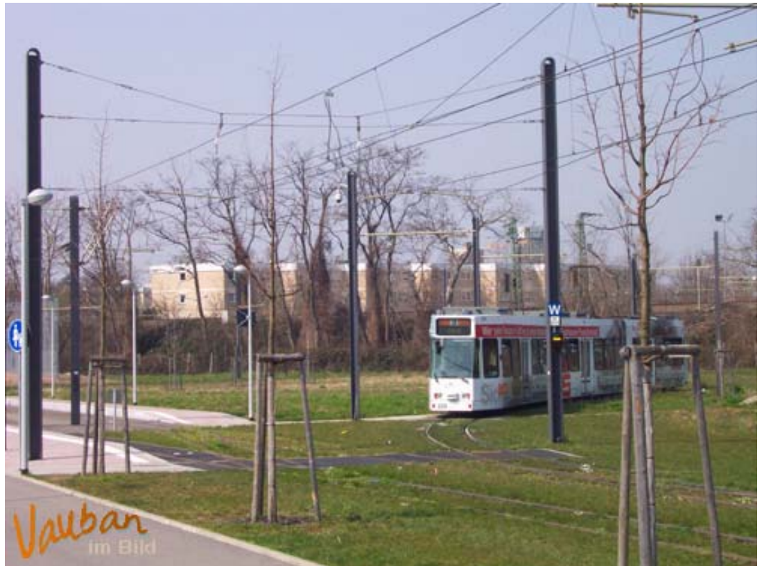
Wendeschleife der Stadtbahn Linie 3 Vauban – ein neues Baugebiet?

Die Wendeschleife, die das Haus Haag als eine von fünf Flächen beispielhaft für eine Bebauung präsentiert, ist für diesen Zweck denkbar ungeeignet. Das müßten die Planer eigentlich auch feststellen, ob die Politik dies dann auch aufgreift, wird fraglich sein. Als erstes ist festzuhalten, daß die Grünfläche im Schienenkreis geschützt ist, handelt es sich doch um die offizielle Ausgleichsmaßnahme für den mächtigen Buchensaum, der im Zuge des Stadtbahnbaus an der Merzhauser Straße gerodet wurde. Es ist ein trauriges Kapitel für sich, wie solche Ausgleichsmaßnahmen gehandhabt werden und wie sie nicht verhindern, daß