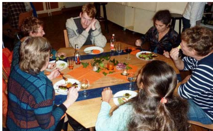
Regel Austausch zwischen HelferInnen und Hauptamtlichen.

Unter den Sängerinnen befand sich die neue Leiterin