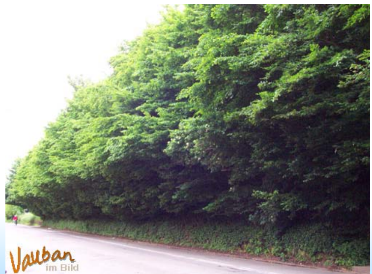
Buchensaum (gerodet) an der Merzhauser Straße

Natur in der Stadt Schritt für Schritt verschwindet. Verwirrung gibt es auch um die Flächen des urbanen Gärtnerns. Es heißt vage, sie sollen "vielleicht" erhalten bleiben. Der Schmetterlingsgarten wurde als öffentlichkeitswirksame Aktion von "Freiburg packt an" und mit viel Engagement von BewohnerInnen ange-